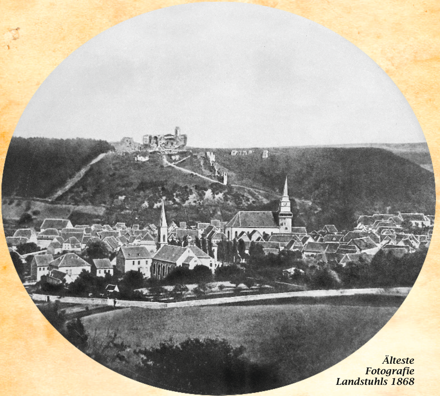
Älteste Fotografie Landstuhls 1868