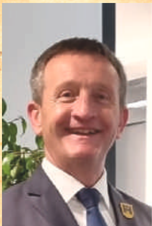
Ralf Hersina Bürgermeister der Stadt Landstuhl