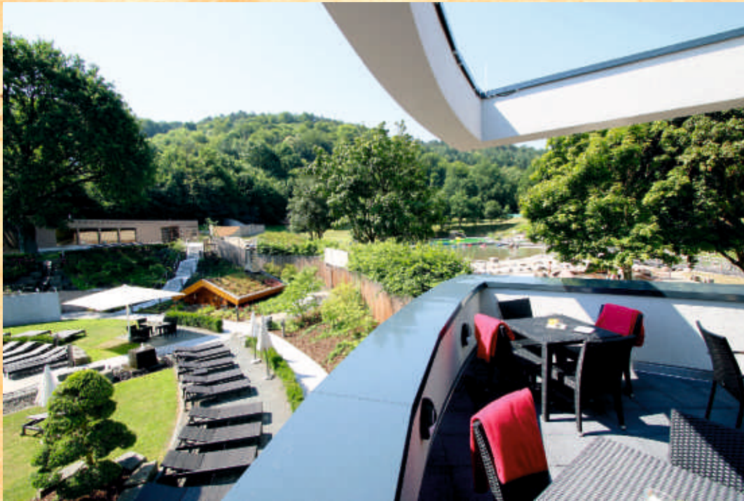
Cubo und Naturerlebnisbad