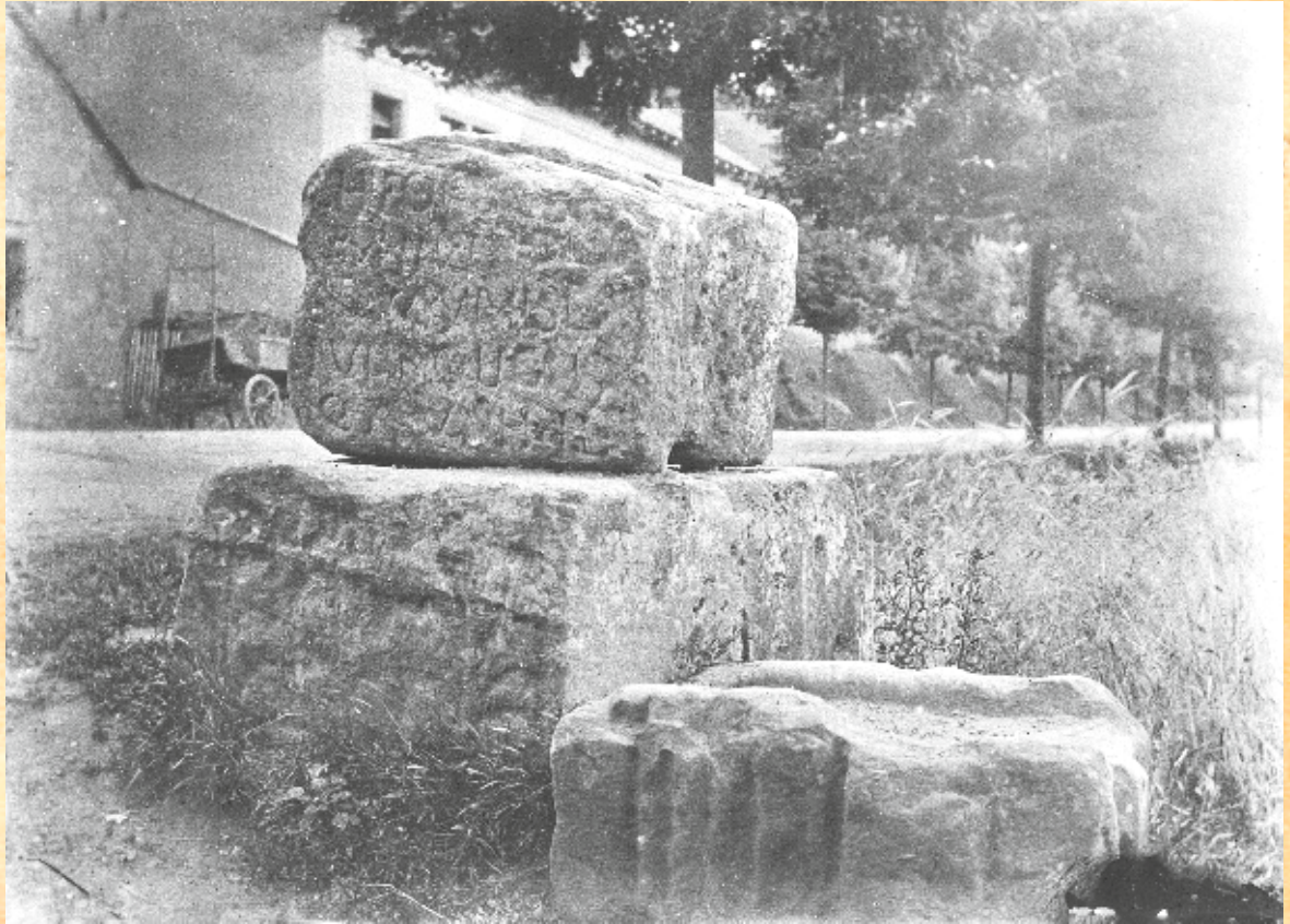
Sickinger Würfel noch am alten Standort Kaiserstraße

An dieser Durchgangsstraße entstanden in jener Zeit einige Siedlungen als Raststätten in Abständen von je einer Tagesetappe. Es waren Königshöfe, denen eine Anzahl Bauerngüter, königliche Huben, zugeordnet wurden, die beim Eintreffen des Herrschers oder seiner Boten für Verpflegung zu sorgen hatten. Einer dieser bekam irgendwann vor 800 nach seinem ersten Verwalter den Namen Nannenstuol, Sitz des edlen