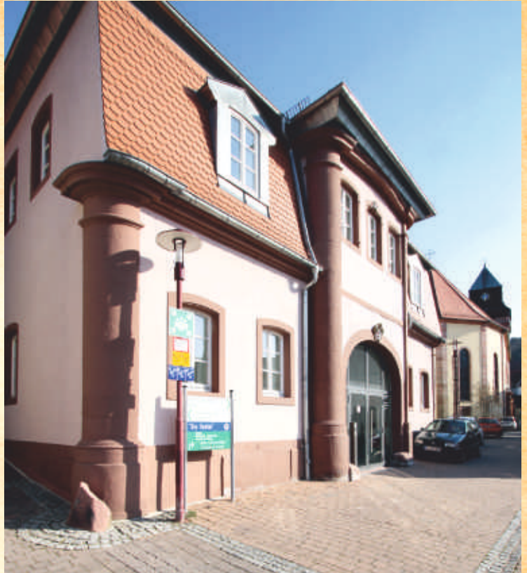
Alte Rentei in der Kirchenstraße

Knapp 100 Jahre später wurde das eindrucksvolle Gebäude erneut zerstört. Gegen Ende des 19. Jahrhunderts begann man mit vereinzelten Renovierungs- und Wiederaufbauarbeiten. Dennoch ist die Anlage nach wie vor eine Ruine, deren korrekte Bezeichnung heute „Burg- und Schlossruine Nanstein“ ist. Schließlich sind mehr Bauteile aus ihrer Zeit als Schloss vorhanden als aus der Zeit Franz von Sickingens.