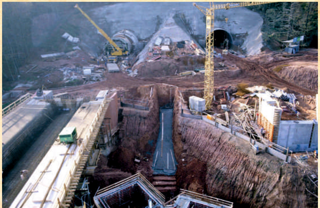
Bauarbeiten am Hörnchenberg Tunnel