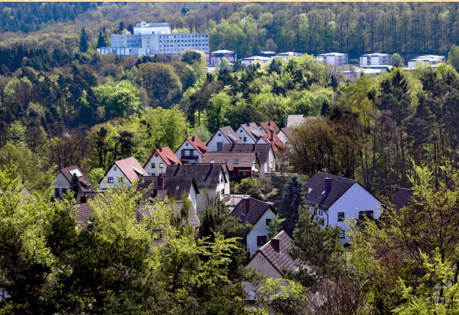
Die „Atzel“ und das St. Johannis Krankenhaus