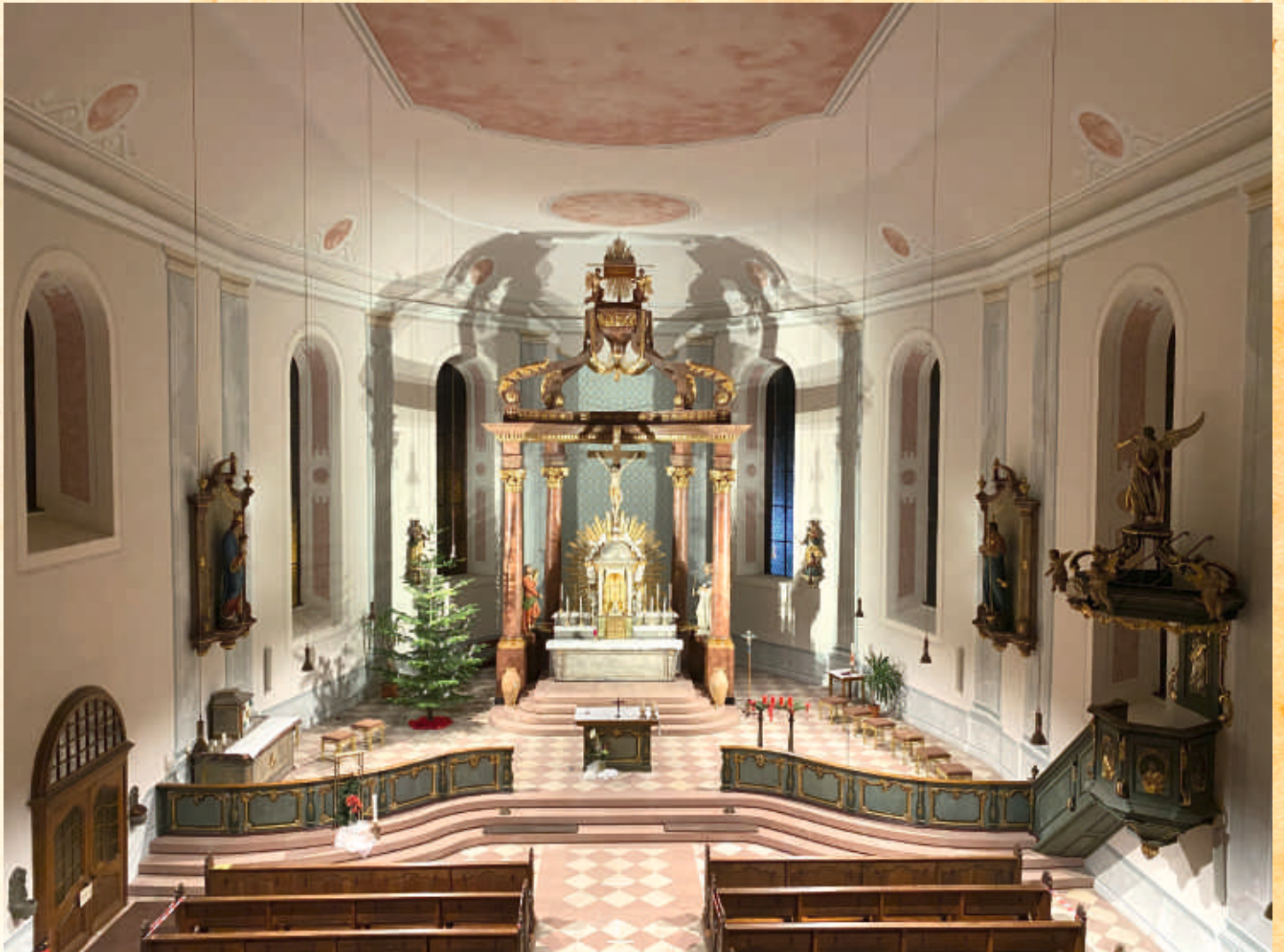
Innenansicht der St. Andreas Kirche Landstuhl 2020