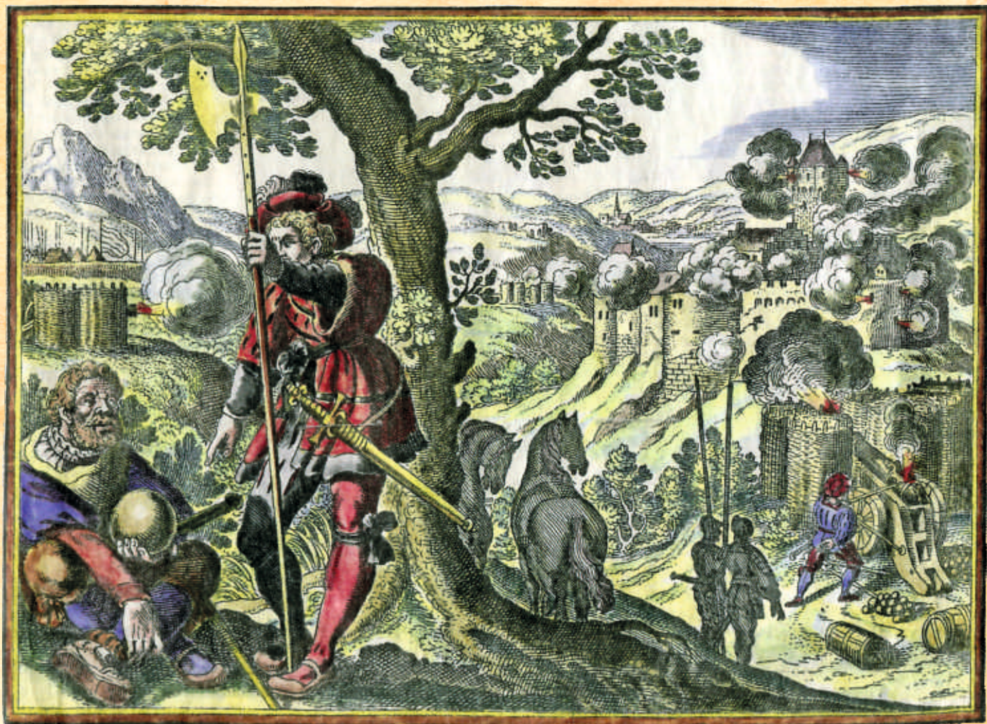
Kolorierter Stich aus dem 16. Jahrhundert